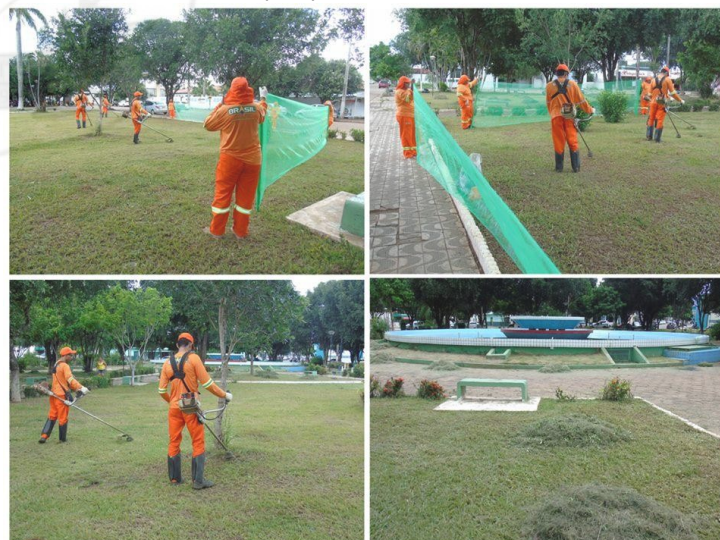
Roçagem feita na praça 07 de setembro 03/06/2022

Com relação à manutenção e limpeza dos lotes particulares, os proprietários ou possuidores a qualquer título de imóveis urbanos edificados ou não, lindeiros às vias ou logradouros públicos, beneficiados ou não com meio-fio e/ou pavimentação asfáltica, são obrigados a mantê-los limpos, capinados e drenados, respondendo, em qualquer situação, por sua utilização como depósito de lixo, detritos ou resíduos de qualquer natureza.